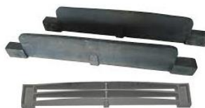
Grelhas de Fornalha