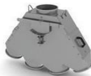
Pendular 4 Saídas