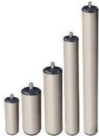
Roletes de Fita