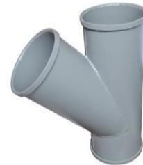
Entrada Dupla 45°