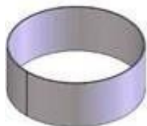
Anel de Reforço