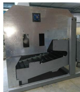
Máq Pré Limpeza