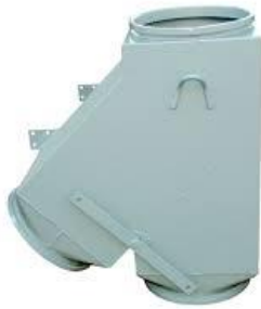
Bifurcada de Linha 45°