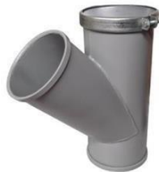
Amortecedor Final / Tampa