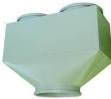
Entrada Dupla Plana