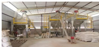
Fábrica de Ração