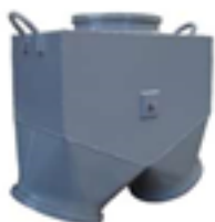
Divisor de Fluxo