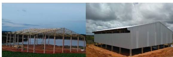
Estrutura Metálicas /Barracão