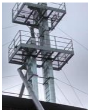
Elevadores de Grãos